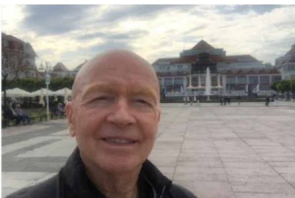
Een selfie in Sopot, Polen

Een van de mogelijke gevolgen van de Brexit die me verontrusten, is een mogelijke achteruitgang van de wereldhandel en de hervormingsinspanningen die wereldwijd worden gedaan. Het Poolse politieke klimaat wordt overschaduwd door de opkomst van de heersende nationalistische Wet en Rechtvaardigheid partij die wordt geleid door Jaroslaw Kaczynski. Kaczynski is de tweelingbroer van de vroegere Poolse president, die in 2010 omkwam tijdens een vliegtuigcrash bij het landen in Smolensk in Rusland. De Poolse mensen zijn erg trots en tuk op hun onafhankelijkheid en identiteit, en het nationalisme is onder het beleid van de Wet en Rechtvaardigheid toegenomen. De opkomst van het nationalisme is geen uitsluitend Pools fenomeen, aangezien de Brexit aangeeft dat dit zich veel verder verspreidt. Een opkomst van een nationalistisch gevoel kan samenhangen met een onrustwekkende achteruitgang van de wereldhandel, en een isolationistische houding van politici kan ertoe leiden dat hervormingen die zorgen voor een meer groeigericht beleid en privatiseringen worden afgeblokt. Dat is voor ons een bezorgdheid.