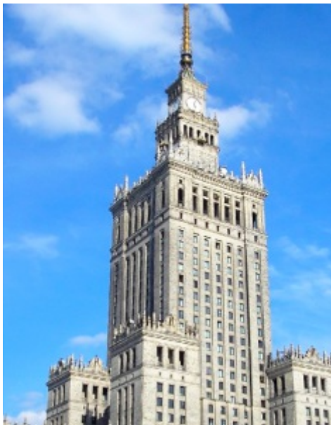
Het Poolse Paleis van Cultuur en Wetenschap

Mijn eerste bezoek aan Polen dateert van 1991, toen het land net zijn communistische verleden had afgeschud. In die tijd was Warschau een grimmige stad met lege winkelramen en winkels waar weinig te kopen viel. In het hart van de stad lag (en ligt) het 231 meter hoge “Paleis van Cultuur en Wetenschap in naam van Jozef Stalin,” een geschenk van de Sovjet-Unie (de naam van Stalin werd later verwijderd). Vele zeggen dat het opmerkelijke gebouw – dat het patroon volgt van gelijkaardige gebouwen in Moskou met gotische torens afgewerkt met rijkelijk versierde torenspitsen en enorme standbeelden – lijkt op een bruiloftstaart. Vandaag is Warschau een levendige en moderne stad met vele wolkenkrabbers die de skyline versieren, en veel voorzieningen voor bewoners en bezoekers, met onder andere een aantal bekende hotelketens, koffieshops, restaurants en winkels.