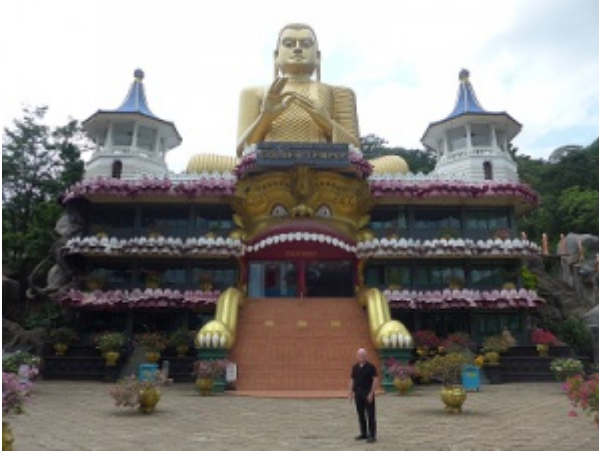
Een bezoek aan de Gouden Tempel in Dambulla, Sri Lanka.

Het was een uur rijden van Sigiriya naar de boeddhagrotten van Dambulla (en de Gouden Tempel van Dambulla). Het was een belangrijke stop omdat die het belang van het boeddhisme in het land benadrukte, wat ook duidelijk bleek uit de talrijke pelgrims, gekleed in het wit en met bloemen in hun handen, die samen met ons 160 meter trappen beklommen om de grotten te bereiken en eer te betuigen aan de 153 boeddhabeeeldjes en de voortreffelijke schilderingen over het leven van Gautama Buddha.