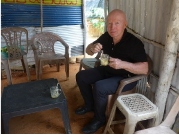
Genieten van de lokale yoghurt met stroop in Sri Lanka.

De volgende dag begon onze autorit doorheen het land terug naar Colombo, zodat we de toestand van het wegennet konden bekijken. De weg was uitstekend: een snelweg met een effen wegdek en twee rijstroken. We trakteerden onszelf onderweg op ossenmelkyoghurt met stroop, een soort honing op basis van kokosnotensap (een plaatselijke specialiteit). Het was een mooi voorbeeld van de manier waarop mensen met een beperkt inkomen hun inkomsten uit landbouw aanvullen met een toeristisch extraatje. Toen we onze weg vervolgden, vertelde onze chauffeur ons dat de Bevrijdingstijgers van Tamil Eelam (LTTE) tijdens de oorlog waaraan uiteindelijk in 2009 een einde kwam, talrijke langs de weg geplaatste bommen op afstand tot ontploffing hadden gebracht om regeringstroepen te doden. We zagen huizen zonder dak die door het leger werden gebombardeerd omdat er LTTE waren aangetroffen. Onderweg zagen we ook grote cisternen die ten tijde van koningen uit vorige eeuwen waren aangelegd om uitgestrekte landbouwgebieden te irrigeren voor de verbouwing van suikerriet en rijst. In de stad Matale zagen we grote, weelderige huizen. In het midden van de stad stond een bijzonder fijn afgewerkte hindoetempel in een waaier van kleuren met honderden beelden. De stad had rijkdom vergaard door de handel in specerijen, voornamelijk kaneel. Hoewel de meeste inwoners van het land het boeddhistische geloof aanhangen, zijn er naast kleine groepjes christenen ook een aanzienlijk aantal hindoes en moslims.