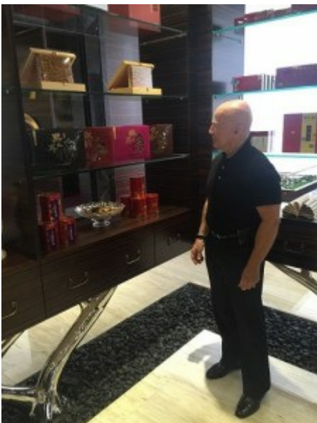
Snuisteren door moderne en traditionele Chinese

We ontmoetten in Shenzhen ook een aantal topmanagers van een bedrijf dat zich specialiseert in ultrakrachtige laserapparatuur. We zagen geautomatiseerde machines ontworpen om hoge volumes te produceren en verschillende producten die met lasers werden vervaardigd of versierd, zoals glas gegraveerd met lasersdesigns, telefoonhoesjes gegraveerd met lasers, en staal dat door lasers in vorm werd gesneden om te worden gebruikt in de scheepsbouw en de autoproduktie. De meeste machines die zij vervaardigen worden op maat gemaakt voor specifieke toepassingen en specifieke klanten. We vernamen dat het grootste deel van de lasermarkt wereldwijd voornamelijk bedoeld is voor lasers van laag vermogen die worden gebruikt in consumentenelektronica.