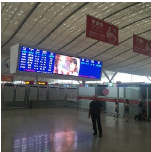
In het station van Shenzhen, op weg naar Nanning

Shenzhen en Hongkong zijn politiek gescheiden, maar de grenscontroles worden steeds soepeler en snelwegen en treinsporen verbinden beide steden met elkaar. Er zijn tussen de twee steden inmiddels zes grensovergangen over land en er is een spoorverbinding die de metro van Shenzhen verbindt met het Mass Transit Railway-metrosysteem van Hongkong. Naar schatting reist elke dag ruim een kwart miljoen mensen tussen Hongkong en Shenzhen. Het metrosysteem van Shenzhen, dat in 2004 werd geopend, telt nu 5 lijnen, 118 stations en 177 kilometer spoor. Uiteindelijk is het de bedoeling dat Beijing, Guangzhou, Shenzhen en Hongkong via een hogesnelheidstrein met elkaar worden verbonden.