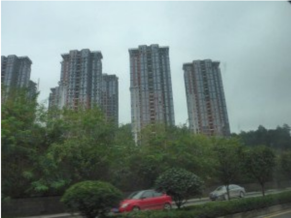
Hoge flatgebouwen in Guiyang, China

Ons team bezocht een nieuwbouwproject in wat een volledig nieuwe stad in de regio bleek te zijn. Het was een enorm complex van 52 gebouwen, elk van 30 verdiepingen hoog en met 120 flats. De terreinen omvatten ook tuinen, fonteinen en een zwembad in Franse stijl. We keken naar de kosten van de gebouwen en de potentiële winsten van het bedrijf. Volgens de ontwikkelaars bestond hun strategie erin om de prijzen te verhogen zodra 60% van het project is verkocht. Hoewel we al hebben vernomen dat de vastgoedprijzen in enkele kleinere Chinese (tweede- of derdelijns)steden dalen, zagen we daarvan geen alomtegenwoordig bewijs. In de gebieden die wij bezochten leek de verkoop nog steeds algemeen solide. Er werd ons verteld dat de meeste kopers in dit gebied niet speculeerden en echt van plan waren om in de nieuwbouwprojecten te gaan wonen. 20% zou afkomstig zijn van het platteland. Er zijn twee lichte spoorwegen gepland om de mensen van en naar het nieuwbouwproject te brengen waarvan één een directe verbinding vormt met het oude stadscentrum. Net als het zuivelbedrijf dat we in Nanning bezochten, hebben ook vastgoedontwikkelaars hun activiteiten uitgebreid naar een aantal andere sectoren, van gezondheidszorg via technologie naar bakolie.