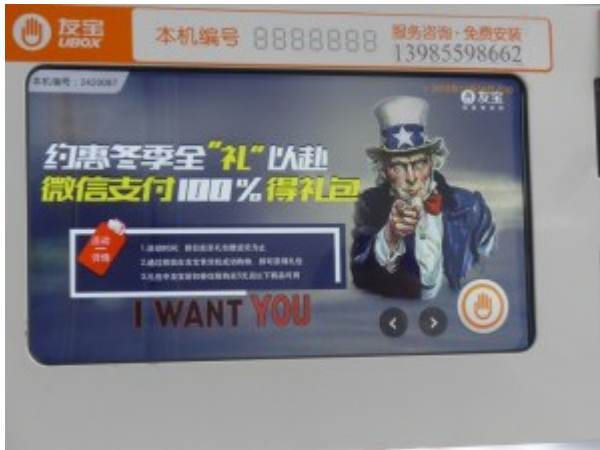
Een vleugje Amerikaanse cultuur in China

Weer aangekomen in het hotel, was ik gefascineerd door een human-interestprogramma in het Chinees dat 'Wacht op mij' heette, en waarin mensen werden opgevoerd die het contact met familieleden waren verloren of die op zoek waren naar andere mensen, en die hoopten ze via deze manier te bereiken. Een jong meisje vertelde dat een jongen haar op de trein met haar bagage had geholpen, en dat hij erg aardig voor haar was geweest. Ze was te verlegen om zijn naam of telefoonnummer te vragen, maar ze kon hem maar niet vergeten. Het programma slaagde erin de jongeman op te sporen, die haar kennelijk ook niet uit zijn hoofd had kunnen zetten, en zelfs het biljet van hun gedeelde reis had bewaard. Het publiek ging helemaal uit zijn dak toen de twee met elkaar werden verenigd en lieten blijken dat ze elkaar graag beter wilden leren kennen. Voor mij illustreert het programma de universele en fundamentele menselijkheid van het Chinese volk, en hun sterke persoonlijke en familiebanden. Ongeacht onze verschillen heb ik op mijn reizen alvast één ding geleerd: dat het niet alleen belangrijk is dat je de cultuur kent van het land waar je zaken doet, maar dat mensen over de hele wereld in veel opzichten in wezen hetzelfde zijn.