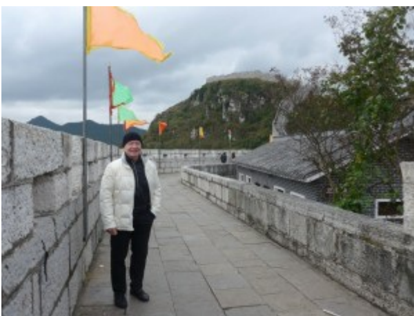
Qingyan Ancient Town, China

Op onze reis bezochten we ook Qingyan Ancient Town, een beroemde historische en culturele trekpleister net ten zuiden van Guiyang, waar we genoten van de oude architectuur. Nu is het een toeristische trekpleister, maar oorspronkelijk is de stad in 1378 tijdens de Ming-dynastie gebouwd als een militaire uitvalsbasis, en bijgevolg werd ze omringd door een muur. De omgeving is rotsachtig en de meeste gebouwen en muren in de stad zijn van steen. Langs beide zijden van de hoofdstraat bieden verschillende winkeltjes en restaurants thee, lokale versnaperingen en een groot aanbod van traditionele goederen aan. Er zijn zoveel mooie gebouwen, waaronder tempels, een christelijke kerk en een klooster. Het katholicisme was in 1851 namelijk door Franse missionarissen in het gebied geïntroduceerd. Ook bezochten we het elegante huis van een geleerde die tijdens de Qing-dynastie de keizerlijke examens had gewonnen en tot ambtenaar was benoemd. Hij verzamelde merkwaardige stenen uit heel China, die op de binnenplaats werden tentoongesteld.