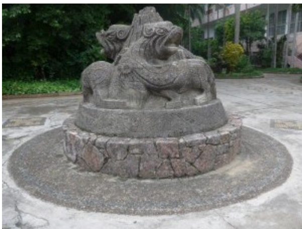
In Nanning, China

We verlieten het winkelcentrum lang nadat de zon onder was en zagen buiten verschillende menigten die stonden te kijken naar groepen dansers die een vastgoedontwikkelingsproject promootten. De vrouwen, gekleed in uniform met het bedrijfslogo, dansten en deelden brochures uit. Voor ons was het een indicatie van de enorme groei van de vastgoedmarkt in de stad, en van de veeleer agressieve verkoopinspanningen van vastgoedontwikkelaars.