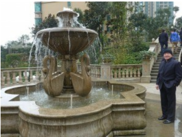
In Guiyang, China

Net als een aantal welvarende steden in China, ligt Guiyang aan een rivier, de Nanming-rivier, een zijrivier van de Wu-rivier. Guiyang is de belangrijkste commerciële hub van de provincie, en een aantal lokale en internationale bedrijven hebben er kleinhandels- en groothandelsactiviteiten. Waterkrachtcentrales langs de rivier leveren wel 70% van de elektriciteit van de stad, naast de kolencentrales die worden voorzien van steenkool dat in de provincie wordt gemijnd.