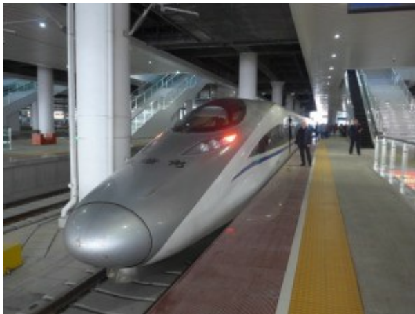
Train à grande vitesse à Guiyang, gare chinoise

Comme vous le savez si vous avez suivi mes derniers récits, mon équipe et moi sommes en train de visiter plusieurs villes chinoises. Nous faisons un compte-rendu des conditions économiques que nous observons, explorons la culture de l'Empire du Milieu et partons à la rencontre d'entreprises dans le cadre de notre recherche d'opportunités d'investissement. Dans ce blog, nous nous arrêtons sur Changsha, la capitale de la Province du Húnán.