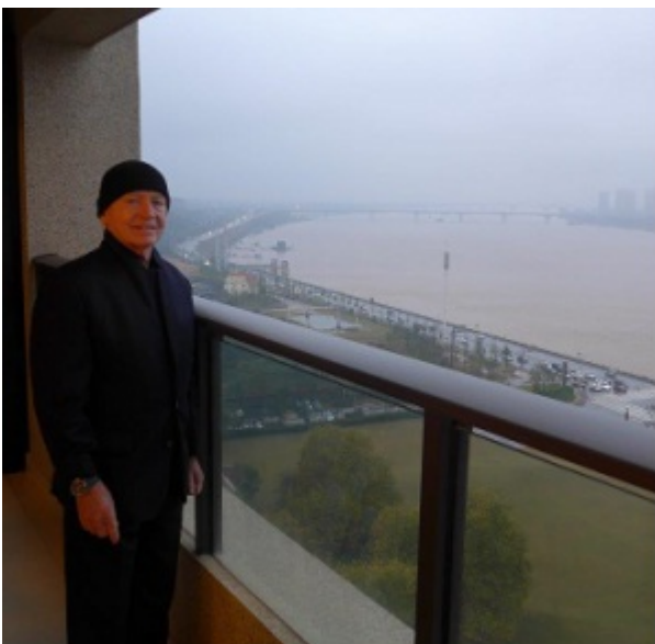
Vue sur la rivière à Changsha en Chine

Changsha est entourée de trois grandes rivières : Xiang, Liuyang et Laodao. La ville est donc un grand centre de distribution de marchandises venant de toute la Chine par voie fluviale sur des péniches et des navires. Les caractères chinois de Changsha signifient « long sable », probablement en raison du banc de sable au milieu de la rivière Xiang, affluent du Yangzi Jiang.